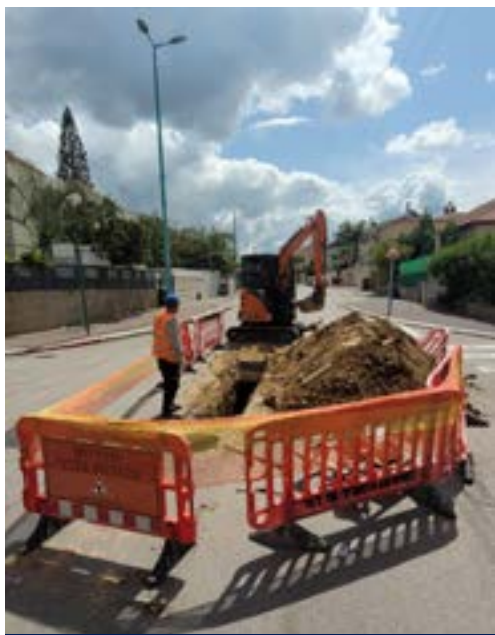
ניפוץ קווי ביוב