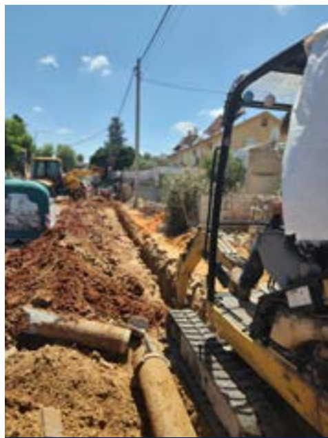
הנחת קווי ביוב בחפירה פתוחה