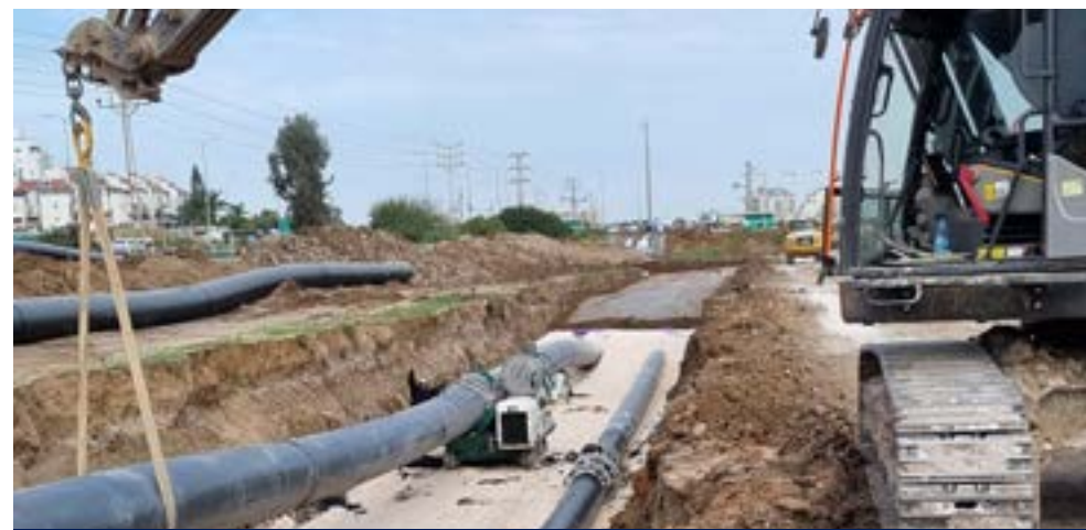
קו סניקה בן שמן ושלב ג ניר צבי