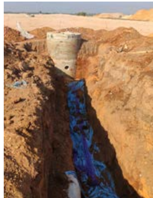
פיתוח שכונת ניר צבי