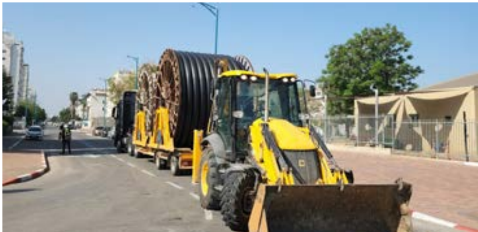
החלפת קו מים תלמים